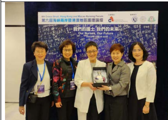
致贈禮品給主辦單位