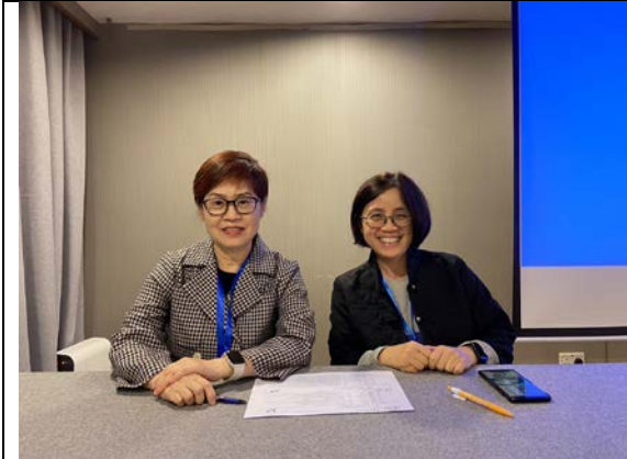
廖副理事長擔任分場主持人