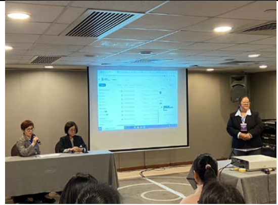
廖副理事長擔任分場主持人