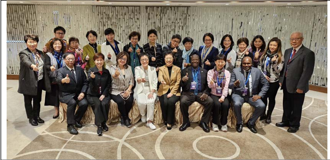
四會與會代表和演講嘉賓合影