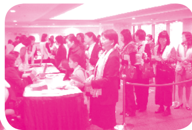
會員代表大會井然有序的報到現場

本人自三年前接篆理事長以來，即不斷要求秘書處制訂各式標準作業流程，發揮會務團隊最大力量，積極提昇服務效率。因應年初總有大量機構會員繳交會費之盛況，已因行政組會務流程